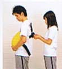
②体験者が、教材本体を腹部に密着させ、パートナーが上のベルトでしっかり固定します。