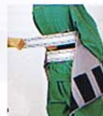
③体験者が、教材本体を腹部に密着させ、パートナーがベルト2本でしっかり固定します。