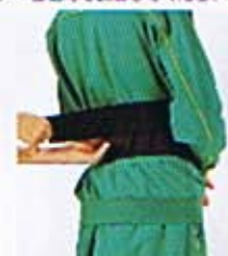
②ウエイトベルトの位置で、圧迫感や感触を調節します(肩胛、腰など)。