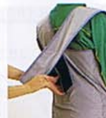
④肩ベルトを交差させて、すり落ちないように固定します。