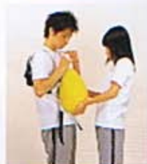
①黄ベルトをかけます。