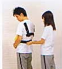
③下のベルトをしっかり固定します。