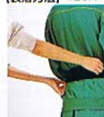
①ウエイトベルト、2kg、1kgを組み合わせ、5.5kg~8.5kgまで4段階で体重調整を調節します。