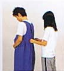
④エプロンをかけます。