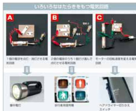
▲電気回路の応用例を示すページ

環境とのかかわりは、環境と森林についての関係 (p.45) や、地球環境を守る新しい技術としての燃料電池・燃料電池電気自動車のしくみを写真と図で詳しく説明したり (p.133)、製品の原料採取から製造、消費・使用、廃棄に至るまでのサイクルにおける環境影響評価という考え方について記述したり (p.134)、生物育成と環境・社会とのつながり (p.182～p.185) などのページを設けたりして、さまざまな角度から技術と社会・環境とのかかわりについて学ぶことができるようになっています。