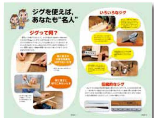
▲ジグの使い方を紹介するページ（折り込み）

また、材料加工に取り組んだ経験のない生徒でも正しく、簡単に、楽しく加工できるように、実習・製作部分には十分なページを割り、新学習指導要領でも取り上げられているジグを使った方法や製作のコツなども紹介しています。