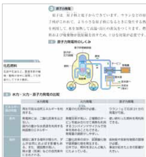
▲さまざまな発電のしくみを解説したページ

す。本教科書では、環境に対する負荷等の観点から、技術を評価することの意義を理解し、主体的に活用する意欲につなげるため、互いに影響を及ぼし合う技術と社会・環境の関係についての学習を深められるように工夫しています。例えば、エネルギー変換に関する技術の章では、水力発電、火力発電、原子力発電のしくみを解説したあとで、それぞれの発電方式やエネルギーとしての電気の高所と短所に関する表・記述を掲載して、生徒が評価しやすくしています。