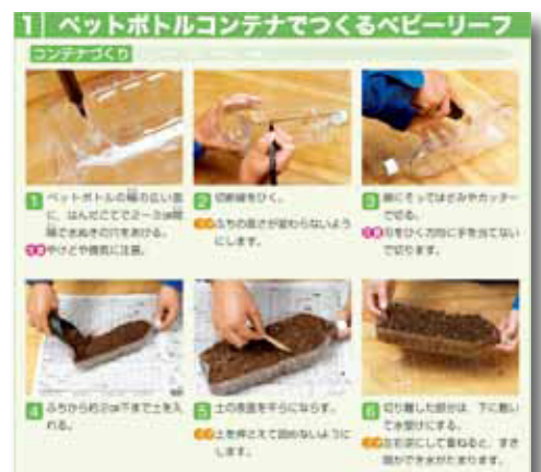
▲ペットボトルコンテナでつくるベビーリーフ

また、栽培のための十分な場所が確保できない学校でも対応しやすいように、実習場所の選定に困らない袋を使ったダイコンの栽培方法も掲載しています。