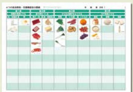
台紙① 裏面 (C 4つの食品群に分類)