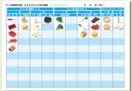
台紙② 裏面 (D 6つの基礎食品に分類)