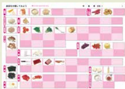
台紙① 表面 (A 食品群に分類)

④ワークシートは A・B・C・D のシール実習とともにワークができる内容になっており、まとめとして、気付いたこと、感想も書き込めます。