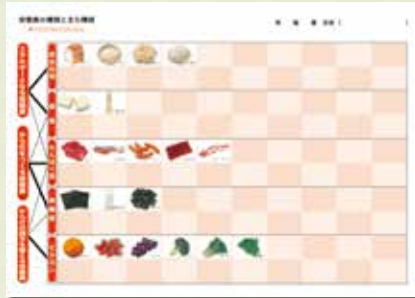
台紙② 表面 (B 栄養素別に分類)