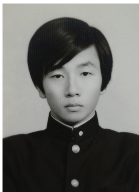
高校生のころの私